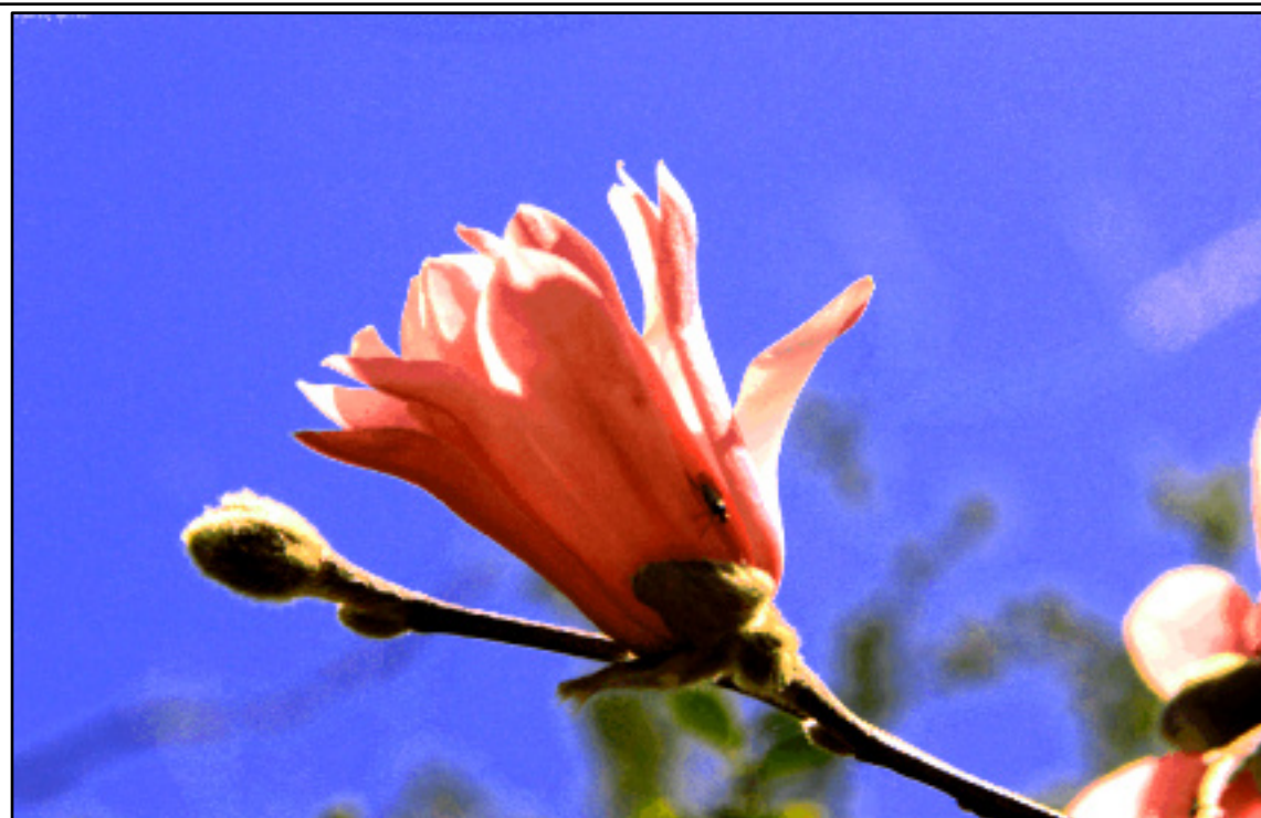
紫木蓮の香り 花言葉は「自然への愛」