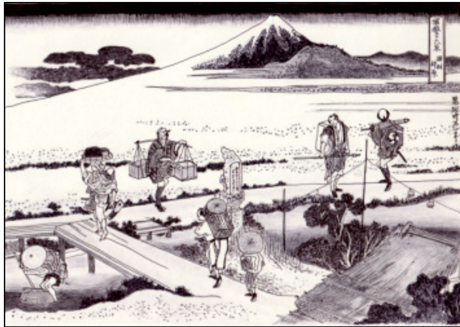
ボールペン画で観る「富嶽三十六景」