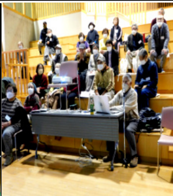
スライドを使って東京大空襲の講演 熱心に聞き入る皆さん