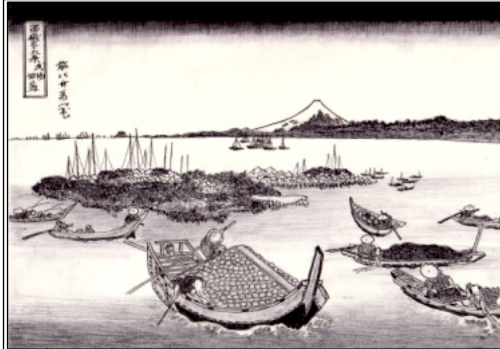
ポールペン画で観る「」富嶽三十六景

中央区佃島は、もともとは隅田川の河口に自然に出来た寄洲でした。徳川家康は大阪の佃島の漁夫を呼び寄せて住ませ、彼らの故郷にち