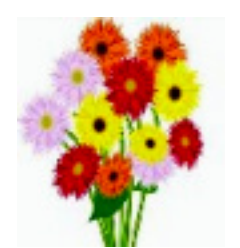
誕生月の花 ガーベラ

日進市年金者の会 日進市蟹甲町中島 277の1 にぎわい交流館内 https://alumnis.jp/nenkin/ 発行責任者 三宅武彦 0561-73-4627