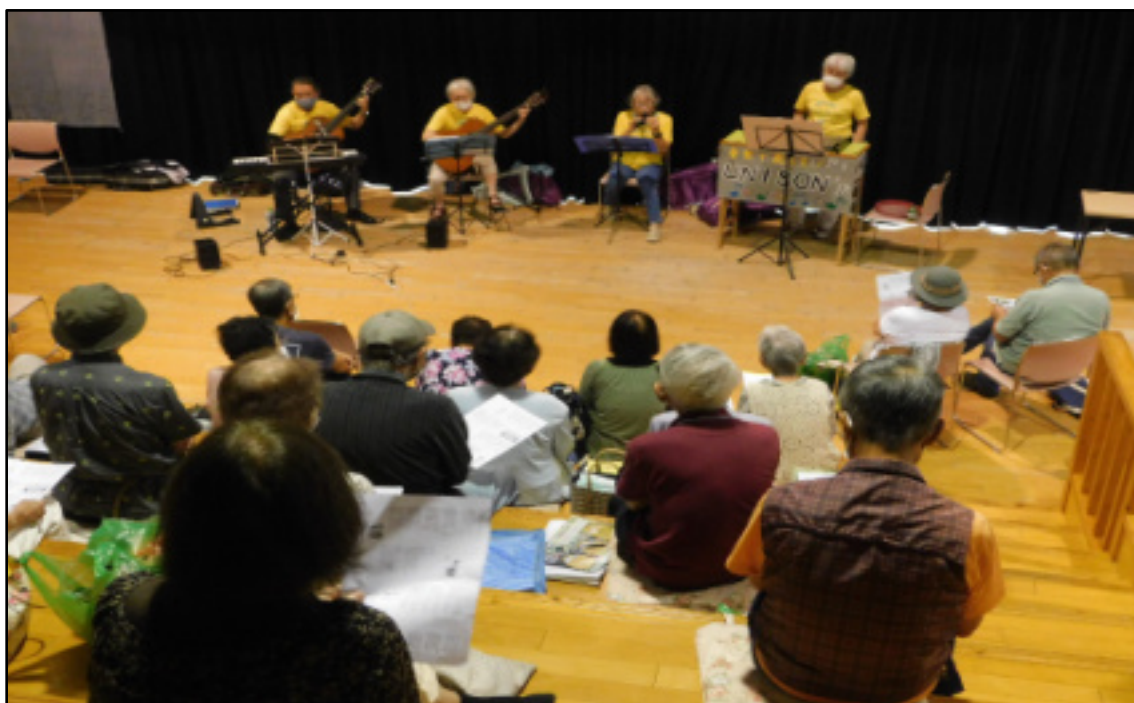
文化サロン「ユニゾズ」の皆さんと歌を楽しみました