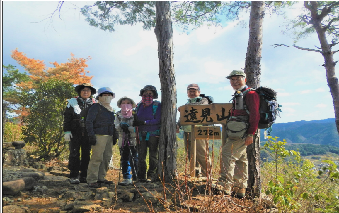
山歩きの会の仲間と遠見山の尾根にて