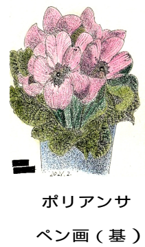
ポリアンサ ペン画(基)

日進市年金者の会 日進市蟹甲町中島 277の1 にぎわい交流館内 https://alumnis.jp/nenkin/ 発行責任者 吉岡正明 0561-73-1801