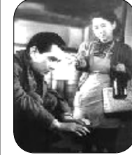
させてくれる味な映画です。石井

何本にも見える「お化け煙突」の近くは、まだ住宅事情が極度に悪かった敗戦後の東京を象徴する地区でした。そのある一軒の借家に住む夫婦と、その二階の部屋を別々に又借りする二人の男女に舞い込んだ、捨て子の赤ん坊をめぐる悲喜劇。時代色を忠実に再現しながら、普通の人間がみな持っている愚かさを冷徹に見つめつつも、かすかな希望の光を感じ