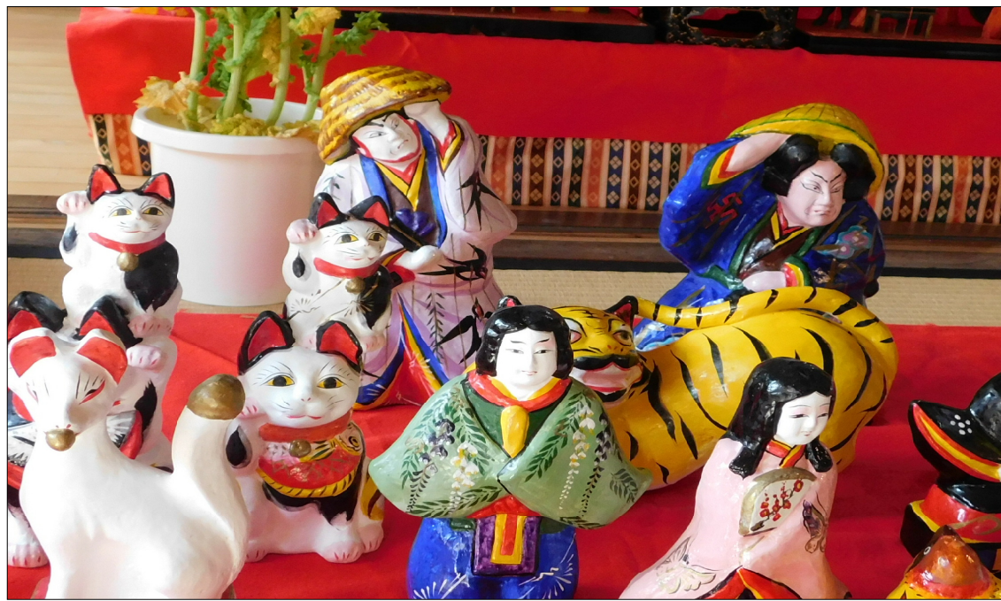
足助中馬のおひなさん