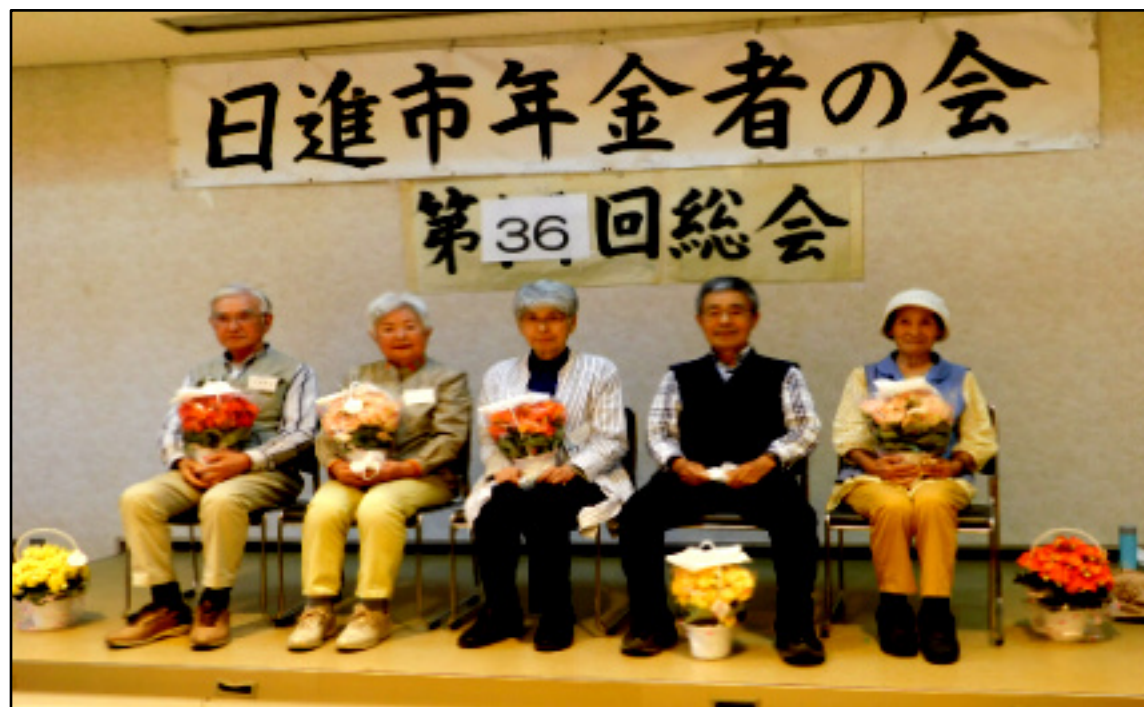
お祝いのペゴニアを手に長寿を祝う