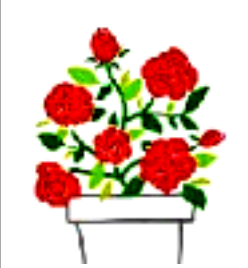
誕生月の花 ミニバラ

日進市年金者の会 日進市蟹甲町中島 277の1 にぎわい交流館内 https://alumnis.jp/nenkin/ 発行責任者 三宅武志 0561-73-4627