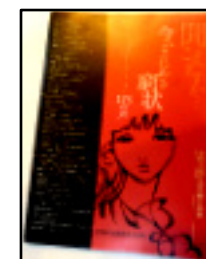
女性の低年金実態告発集 今、ここに ある窮状 175の声