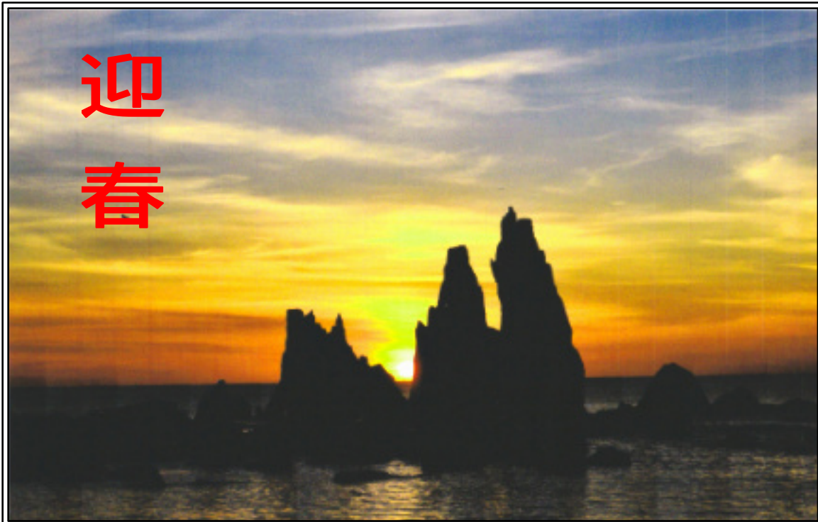
串本 橋杭岩に日の出を迎える