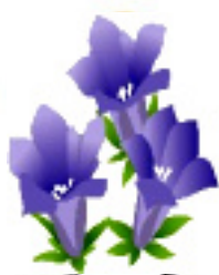
誕生月の花 りんどう

夏の山小屋は沢山の人を受け入れ居心地は良くなかったが、いまは定員の半分程度しか入れないので、のんびりできました。またテント泊が人気になり賑わっていました。テントは一人用ばかりと様変わりしていました。